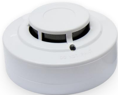
Рис.1. Внешний вид извещателя

Извещатель конструктивно состоит из блока извещателя и розетки (см. рисунок 1).