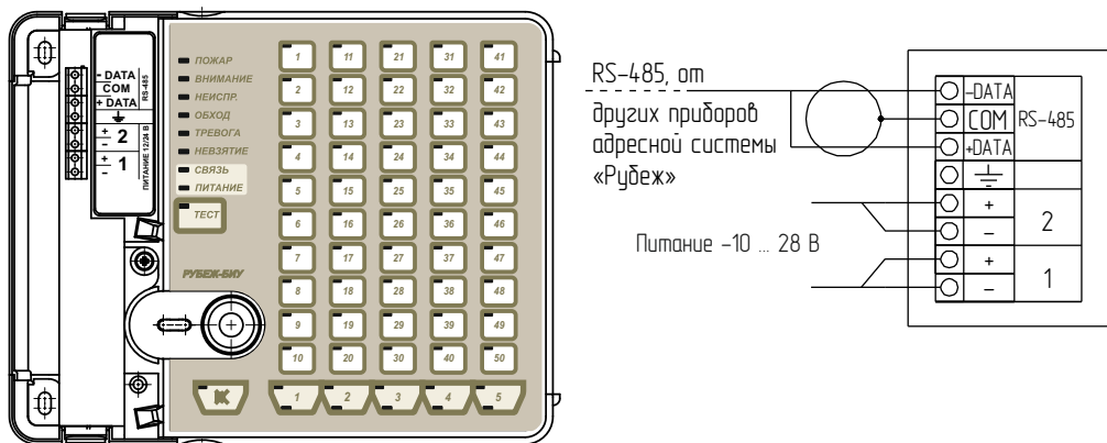
Рисунок 1 - Внешний вид и способ подключения прибора